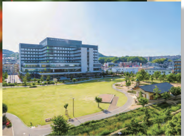
キセラ川西せせらぎ公園