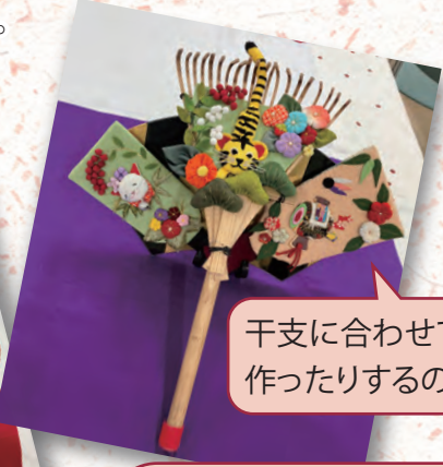
干支に合わせて作品を作ったりするのも楽しいです。