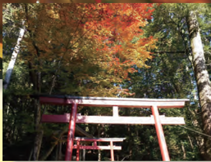
多太神社の秋