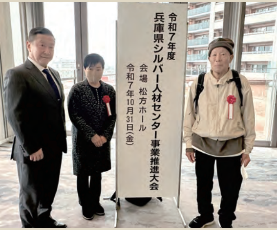
左から 山本常務理事、 常行会員、 奥川会員

これは、シルバー人材センター事業の理念を、広く浸透させるとともに、会員の参画意識を高め、事業の発展拡充を図ることを目的に、兵庫県シルバー人材センター協会の主催で毎年開催されています。