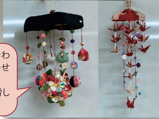
花びらは一枚一枚、綿を入れ膨らまして重ね合わせ、球体は発泡スチロールに布をきれいに合わせ接着します。また鶴は布だけでは折れないため、非常に苦労しました。