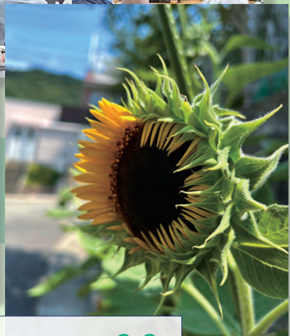
川西市内の夏の風景