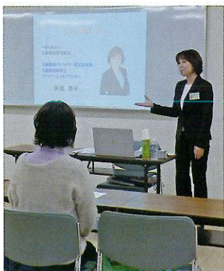
幸せのお片付け(終活)