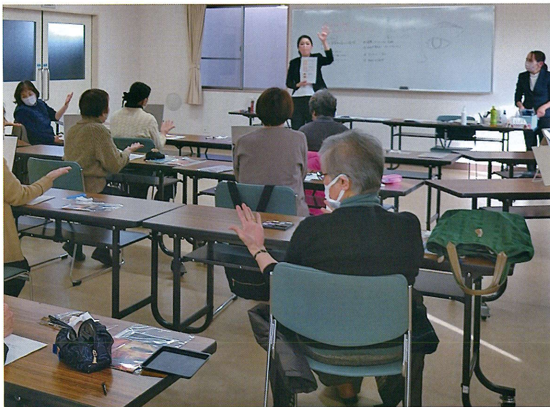
メイクアップレッスンの様子 (1月14日開催)

編集 公益社団法人 川西市シルバー人材センター 発行 〒666-0017 川西市火打1丁目10番9号 TEL 072-758-6234 FAX 072-758-3679 http://www.kawanishi-silver.or.jp