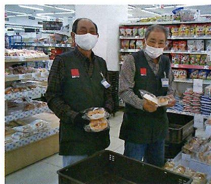
洲上会員(左)と近藤会員

「掃除が終わってからも、店内の床を気にしながら帰られるのを見かけます。本当にありがたいことです」 と、店内清掃の会員のお仕事ぶりも山本店長は褒めていきます。