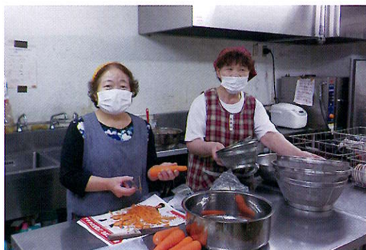
中川会員(左)と山崎会員